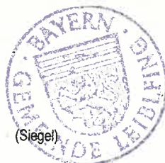
Josef Moll 1. Bürgermeister

Im Zusammenhang mit dem Datenschutz wird ausdrücklich darauf hingewiesen, dass ein Bauleitplanverfahren ein öffentliches Verfahren ist und daher in der Regel alle dazu eingehenden Stellungnahmen in öffentlichen Sitzungen (Fachausschüsse und Gemeinderat) beraten und entschieden werden, sofern sich nicht aus der Art der Einwände oder der betroffenen Personen ausdrücklich oder offensichtliche Einschränkungen ergeben. Soll eine Stellungnahme nur anonym behandelt werden, ist dies auf derselben eindeutig zu vermerken.