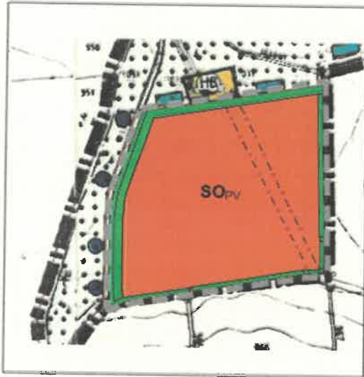
Flächennutzungsplan Deckblatt Nr. 25