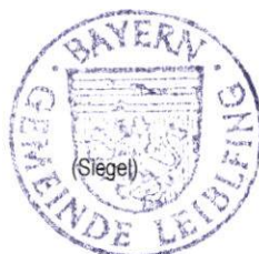
Josef Moll 1. Bürgermeister

angeheftet am: 11.07.2024 abgenommen am: