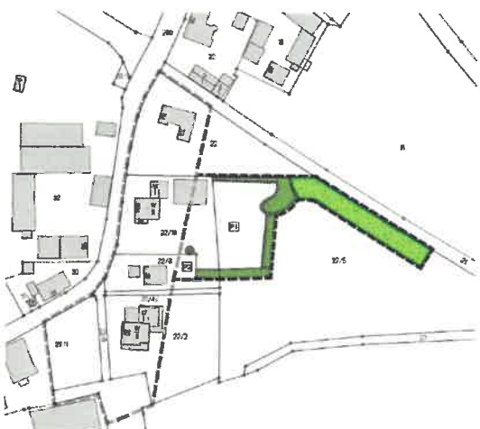
Abbildung: Ausschnitt aus dem Entwurf des Bebauungsplans ohne Maßstab